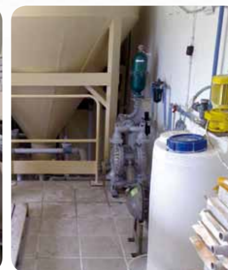
Porcelángyár- szennyvíziszap víztelenítés