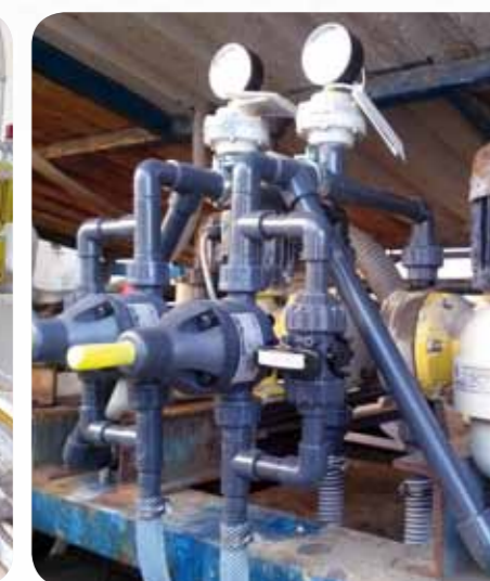
Cukorgyár- vas-klorid adagolás