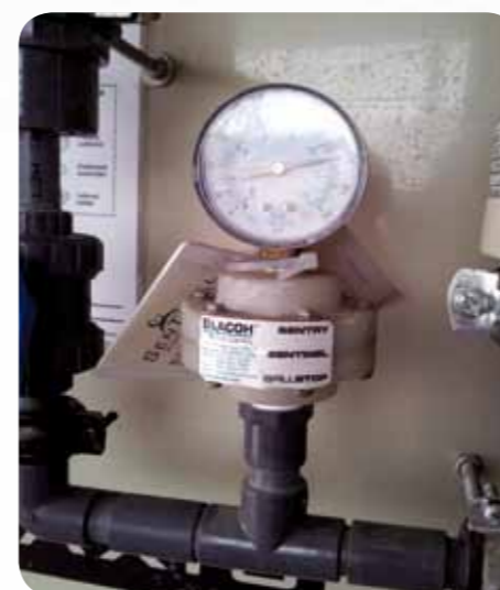
Vegyszeradagoló állomás- elválasztott manométer